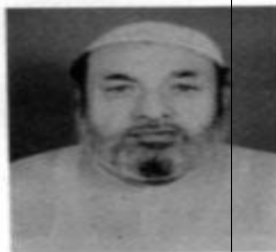
قاضي محمد اكبر